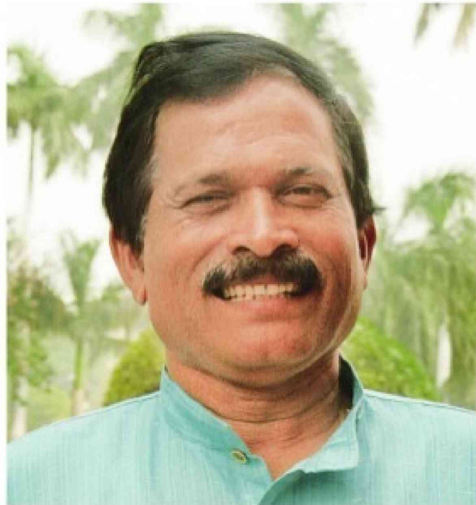
SHRIPAD YESSO NAIK MINISTER OF STATE FOR AYUSH

1 WHAT ARE THE STEPS TAKEN BY THE MINISTRY TO HIGHLIGHT THE BENEFITS OF YOGA? The National Health Editor’s conference on yoga this year will provide an insight into the scientific aspects of yoga and its role in managing stress and improving the overall health of an individual.