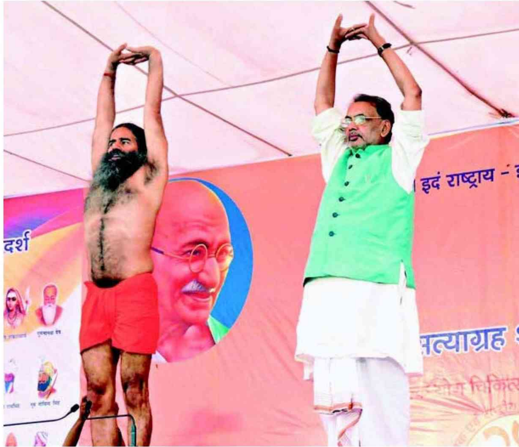
Union Agriculture Minister Radha Mohan Singh performs yoga at an event organised by Baba Ramdev, in Motihari, Bihar, on Thursday