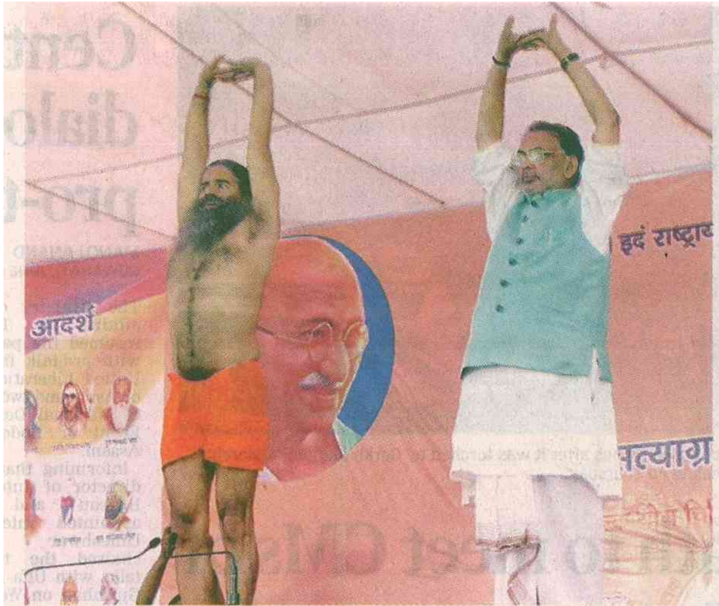
Union agriculture minister Radha Mohan Singh performs yoga during a three-day event, organised by Baba Ramdev, in Motihari, Bihar, on Thursday.