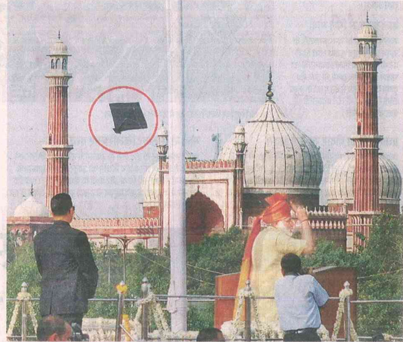
सुरक्षा में सेंध... नई दिल्ली में मंगलवार को स्वतंत्रता दिवस के अवसर पर जब प्रधानमंत्री नरेंद्र मोदी लालकिला की प्राचीर से राष्ट्र को संबोधित कर रहे थे उसी दौरान कहीं से एक उड़ती हुई काली पतंग आई और लहराकर उनके पास गिरी

करीब 650 इमारतों और 150 घरों की खिड़कियों को सील किया गया था। लाल किले के आसपास, आइएसबीटी, गीता कॉलोनी फ्लाईओवर, सिविक सेंटर समेत साठ से अधिक ऊंची इमारतों की छतों पर एंटी एयरक्राफ्ट व एयर डिफेंस गन लगाए गए थे ताकि इनके जरिये हवाई हमले को ध्वस्त किया जा सके। उच्च क्षमता वाले सीसीटीवी कैमरों के लिए पांच कंट्रोल रूम बनाए गए थे।