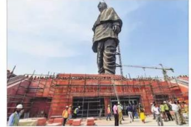
Final touches being given to the 'Statue of Unity' at Kevadiya Colony near Ahmadabad ahead of its inauguration on Oct 31.

Narmada in Gujarat, it is built at a cost of over ₹2,300 crore and will be dedicated to the nation on Wednesday. Modi hoped the statue would become a new tourist destination. The BJP is all set to make it a grand event with Gujarat Chief Minister Vijay Rupani sending invites to all Chief Ministers.