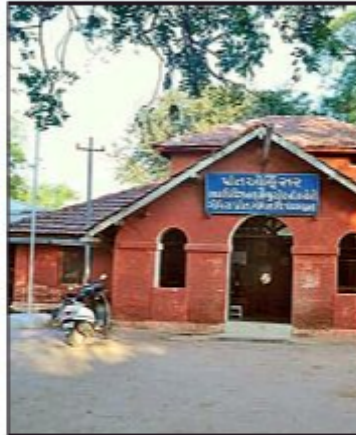
The premises has been vacated and presently lying unused

The SDM office was shifted to the multi-storeyed collectorate office over a year back and the building has been lying vacant since then. Plans to develop a memorial there as a tribute to Patel were discussed, but have not taken concrete shape yet. Of-