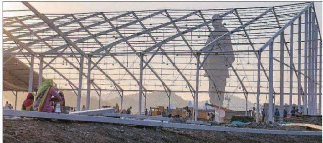
Work in full swing at the site of the Statue of Unity in Kevadia colony on Thursday for the unveiling ceremony. Bhupendra Rana

"We do not have anything against Sardar Patel. But we feel that had he been alive, he would not have agreed to the construction of such a huge statue at such