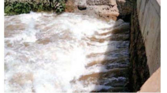
ગોડબોલે ગેટમાંથી ૯૪૧૫ ક્યુસેક પાણી છોડાશે, જેથી નર્મદા ડેમથી ગરુડેશ્વર વિયર સુધીનું ૧૨ કિલોમીટરનું સરોવર ભરાશે. સરોવર ભરાયા બાદ સ્ટેચ્યૂ ઓફ યુનિટીનો નજારો અદ્ભુત લાગશે.

આજુબાજુ પાણી નથી. જેના કારણે હજુ પણ સ્ટેચ્યૂ ઓફ યુનિટીના ફરતે પાણી નહતું. બીજા તરફ ગરુડેશ્વર પાસેના વિયરડેમનું કામ પણ અધૂરું હતું ત્યારે