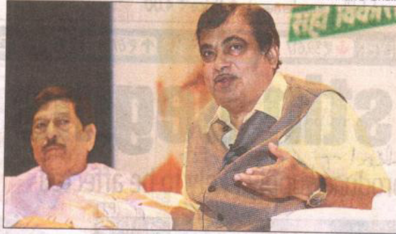
Nitin Gadkari speaking at a press conference in city.

Explaining the delay to start the work of the flyover, he said, "The NHAI has undertaken the Chandni Chowk flyover work. Around 15 hectares of land is needed for the project. The Pune Municipal Corporation (PMC) is acquiring the land. Till date, the civic body has acquired around six hectares of land. I don't allow the work of any project to start till 80 per cent of land is acquired. Now, I am ordering the officials