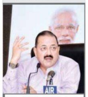
Union Minister Dr Jitender Singh addressing a press conference in Vijayawada on Wednesday

ple are demanding special category status for the state. Then the Union Minister started defending the action of his party flatly accusing the TDP of walking out of the alliance.