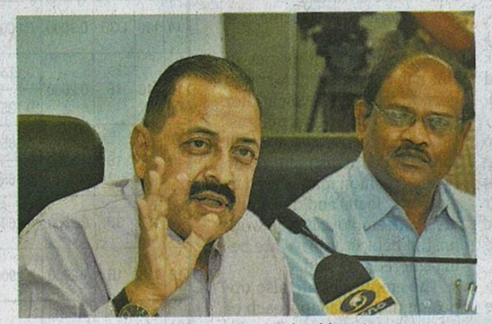
Union Minister of State Jitender Singh addressing a press conference in Vijayawada on Wednesday. • CH.VIJAYA BHASKAR

He said the State government should have waited patiently instead of walking out of the NDA. "The Centre feels this walk out by Chief Minister N. Chandrababu Naidu was more to do with domestic political compul-