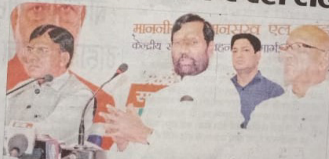
प्रेस चर्चा में बोलते केंद्रीय मंत्री रामविलास पासवान, केंद्रीय राज्यमंत्री मनसुख एल मांडविया और मंत्री सरव राय।

रांची। रांची में शुक्रवार को केंद्रीय खाद्य आपूर्ति मंत्री रामविलास पासवान और परिवहन राज्यमंत्री मनसुख एल मांडविया ने केंद्र सरकार की उपलब्धियां गिनायीं। कहा, सरकार साफ नीयत के साथ सही विकास कर रही है। कहा कि पिछले चार साल से देश बदल रहा है। चुनाव में पहले जनता ने सिर्फ बाधा किया जाता था, लेकिन पहली बार एक ऐसा सरकार देश में बनी है, जो जनता से किये खांटे पर काम कर रही है। प्रधानमंत्री ने कहा था कि सरकार बनेगी तो गांव, ग्रामी, किसान, बच्चों और पीड़ितों के हित में काम करेगी। पिछले चार वर्षों की योजनाओं को देखा जाये, तो सबसे ज्यादा इन्हीं लोगों को फोकस कर सरकार काम कर रही है। पिछले चार वर्षों में एक लाख 24 हजार परिवार को आवास दिया गया है। स्वास्थ्य के क्षेत्र में काम हुए हैं। एक हजार से ज्यादा दवाई का टेड फिक्स कर दिया गया है। नोटबंदी और जीएसटी लागू कर कालाचन पर सौधा प्रहार किया,