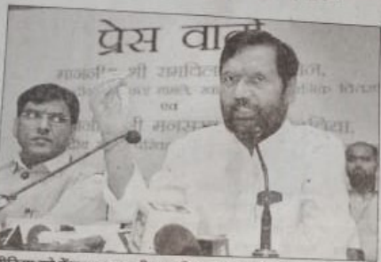
मीडिया को केंद्र सरकार की उपलब्धिताएँ रामविलास पासवान

रांची। केंद्रीय खाद्य आपूर्ति मंत्री रामविलास पासवान ने कहा है कि सरकार को और भी जनहितपूर्ण प्रणाली के माध्यम से दिये जाने वाले गेहूं-चावल की कीमतों में वर्ष 2019 तक कोई बढ़ोतरी नहीं होगी। जब से देश में खाद्य सुरक्षा कानून लागू हुआ है तब से लेकर अब तक कीमतों में कोई बढ़ोतरी नहीं हुई है। केंद्र सरकार को और से भारतीय खाद्य निगम के माध्यम से रुपये प्रति किलोग्राम की दर पर गेहूं और तौन रुपये प्रति किलोग्राम की दर पर चावल दिया जा रहा है। इसकी कीमतों में वर्ष 2019 तक कोई बढ़ोतरी नहीं होगी। उन्होंने कहा कि केंद्र सरकार को और से संबंधित राज्य सरकारों को महीने की 30 तारीख तक अनाज के लिए पैसा उपलब्ध करा दिया जाता है। राज्य सरकार को यह जिम्मेवारी है कि एक तारीख के बाद इसका लाभ अपने लाभुकों तक पहुंचा दें। श्री पासवान शुक्रवार को संबाददाता सम्मलेन कर केंद्र में एनडीए के चार वर्ष पूरा होने