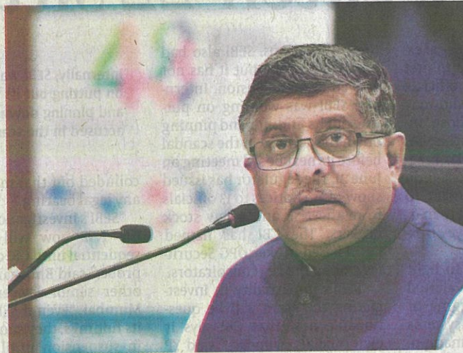
Union Law Minister Ravi Shankar Prasad addressing the media on the 48 months of Transforming India, in Hyderabad, on Thursday. KVS GIRI

took many bold decisions in the interest of the nation, such as the surgical strike across the Line of Contro and the demonetisation of high-value currency notes.