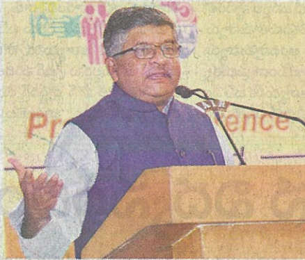
కేంద్ర మంత్రి రవిశంకర్ ప్రసాద్

తెలంగాణ రాష్ట్రంలో ఐటీ రంగం వినూత్న కోణాల్లో సాధిస్తున్న ప్రగతిపై కేంద్ర ఐటీశాఖ మంత్రి రవిశంకర్ ప్రసాద్ ప్రశంసల వర్షం కురిపించారు. యువతకు ఉద్యోగ అవకాశాలు కల్పించడమే కాకుండా వారిని ఇతరులకే ఉద్యోగాలనిచ్చేలా తీర్చిదిద్దుతున్నారని అభినందించారు. సొంత స్టార్టప్లు ప్రారంభించేలా ప్రోత్సహించడం ఆదర్శనీయమని కితాబునిచ్చారు. 'హైదరాబాద్ మహానగరం మొత్తం భారతదేశానికే ఐటీ మహానగరం' అని ఆయన వ్యాఖ్యానించారు. బీజేపీ సారథ్యంలోని ఎన్డీయే నాలుగో పాలన పూర్తయిన సందర్భంగా నిర్వహించిన కార్యక్రమంలో పాల్గొన్న కేంద్ర మంత్రి అనంతరం మీడియాతో మాట్లాడారు. ఈ సందర్భంగా.. హైదరాబాద్ ఐటీ పరిశ్రమ విశేష వృద్ధిని సాగిస్తూ యువతకు అవకాశాలు కల్పించే వేదికగా నిలుస్తున్నదని ప్రశంసించారు. 'కొద్దికాలం కిందట ఓ ప్రముఖ కంపెనీకి చెందిన సీఈవో నన్ను కలిశారు. ఆ సందర్భంగా ఆయన ఓ ఆసక్తికర అంశాన్ని పంచుకున్నారు. హైదరాబాద్ కు చెందిన యువత ఐటీ రంగంలో ఏదో ఒక ఉద్యోగాన్ని పొందడం అనే ఆలోచనకంటే తమ సొంత స్టార్టప్ను ప్రారంభించుకునేందుకు ప్రాధాన్యం ఇస్తున్నారు. ఇలాంటి వృద్ధి సాధిస్తున్నందుకు హైదరాబాద్ కు శుభాకాంక్షలు' అని ఆయన అభినందించారు. భూసేకరణ కారణంగా ఇదివరలో యూపీఏ సర్కారు ప్రారంభించిన ఐటీ